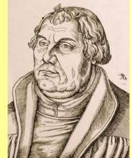
Martin Luther (1483- 1545)